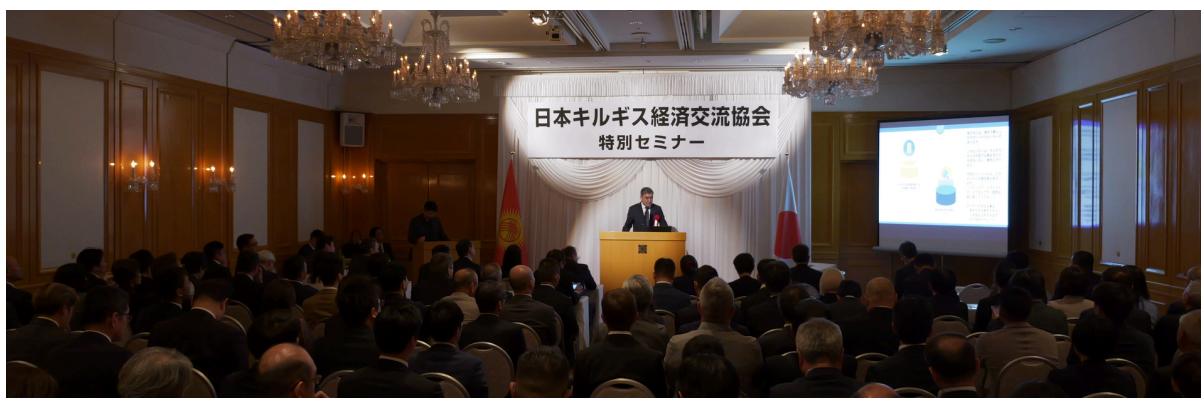
カナット大臣によるご講演